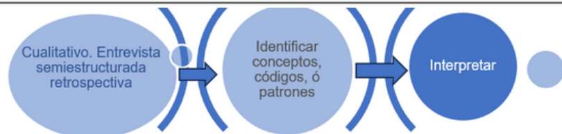
Figura 1. Mapa de diseño metodológico.