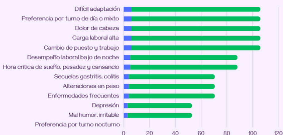
Figura 2. Resultados.